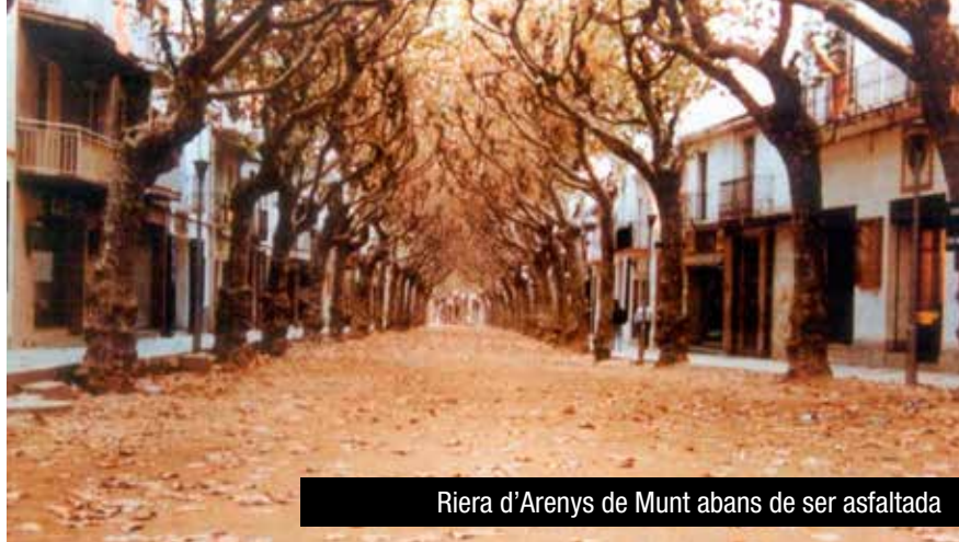
Riera d'Arenys de Munt abans de ser asfaltada

Van sorgir també altres mobilitzacions importants: La plataforma Salvem la Riera de Pineda i la PAACAM -després Salvem la Riera- d'Arenys de Munt, plataforma que va fer una lluita molt dura i contundent (amb vagues de fam, manifestacions, contenciosos...) i amb la concreció d'un model realment alternatiu al tot el sistema imperant a Arenys de Munt fins a aquell moment. També a Malgrat hi ha hagut l'experiència de la plataforma Salvem l'Arbreda de Can Feliciano en aquesta línia.