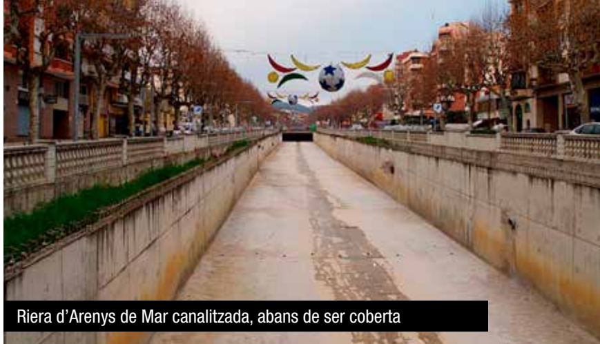
Riera d'Arenys de Mar canalitzada, abans de ser coberta

Això s'ha manifestat en la generalització dels cobriments, soterraments, canalitzacions amb marges no permeables, impermeabilitzacions, transformacions en vials urbanitzats . Aquest fet ha suposat la disminució d'aportacions de sorra a les platges per la manca de sediments dins la pròpia llera desapareguda o alterada, la pèrdua d'aportacions d'aigües als aqüífers (per impermeabilització), l'augment de la perillositat per obres temeràries, l'acceleració de les rierades en lleres més estretes i impermeables, i la degradació de la vegetació pròpia i del paisatge de la nostra comarca.