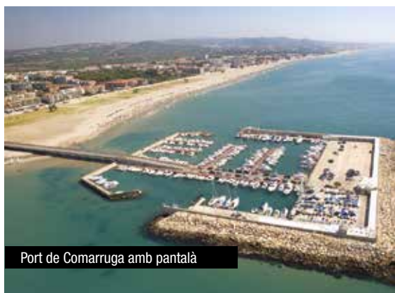
Port de Comarruga amb pantalà

La nova vella perspectiva és que les administracions continuaran pagant tota mena de regeneracions i intervencions per establir trams de passeig marítim, vies ferroviàries o mobiliari urbà de les platges i que el contribuent, el sector pesquer i el medi natural seran els perjudicats.